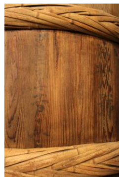
▲樽には「明治三十年」の文字